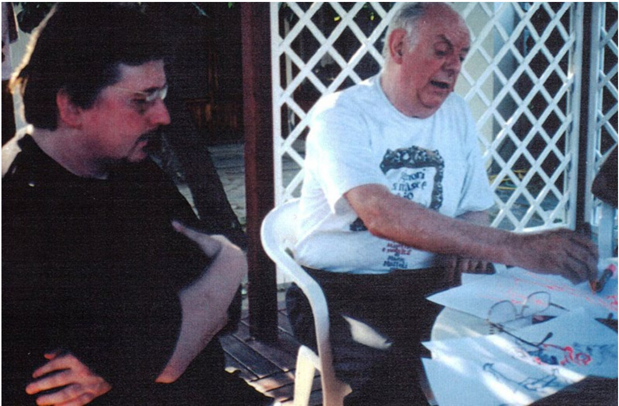
En répétition avec Dario Fo