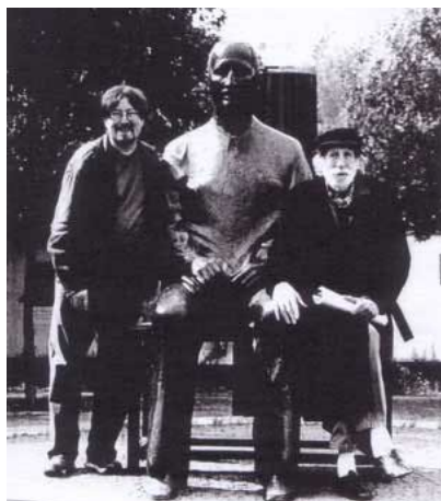
Au Berliner Ensemble, avec George Tabori et BB