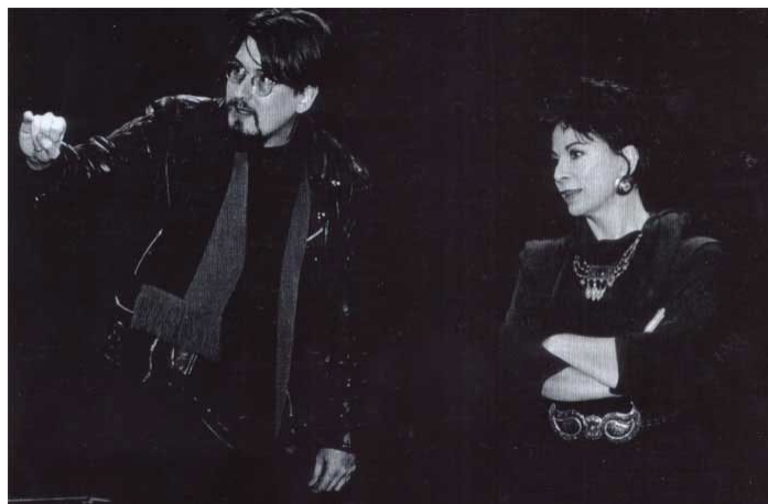
En répétition avec Isabel Allende