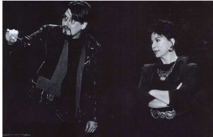
En répétition avec Isabel Allende