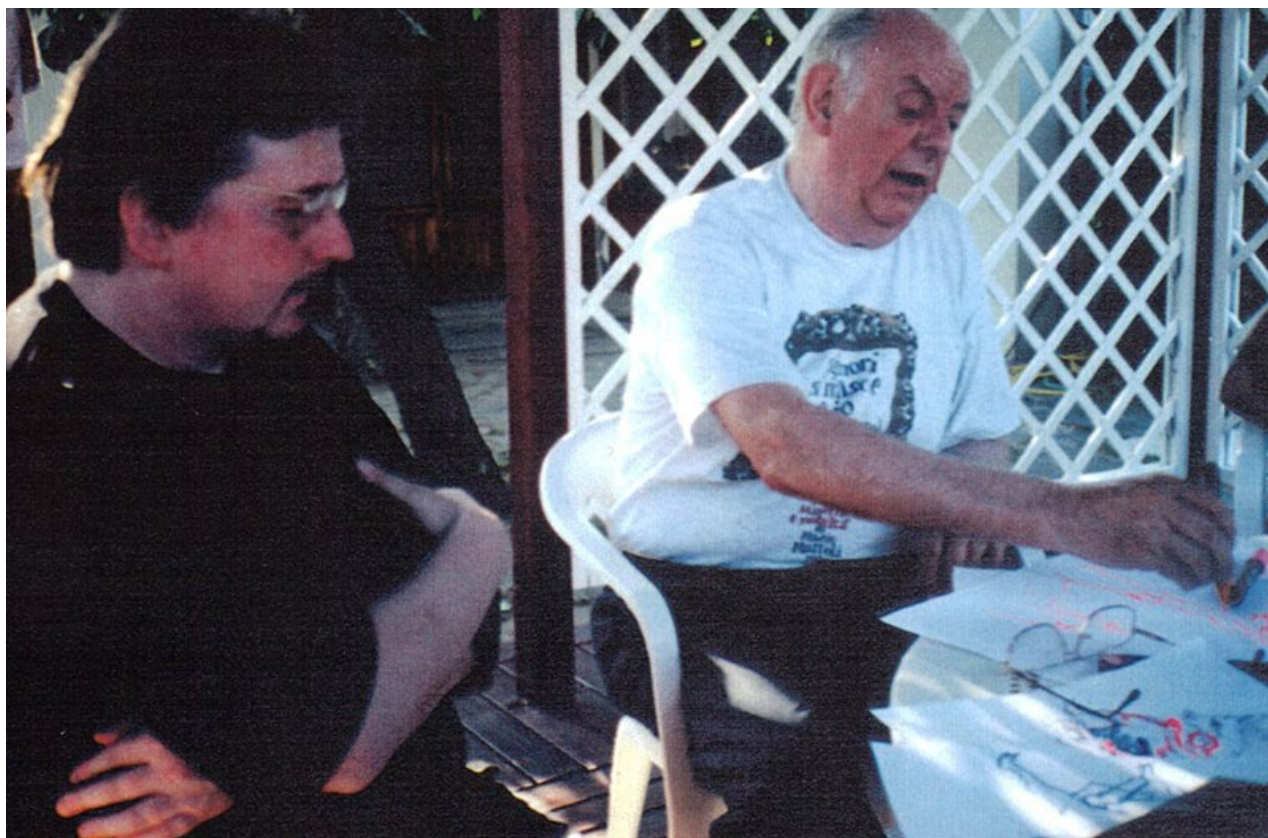
En répétition avec Dario Fo