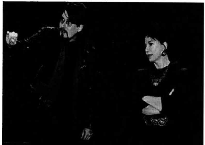
En répétition avec Isabel Allende