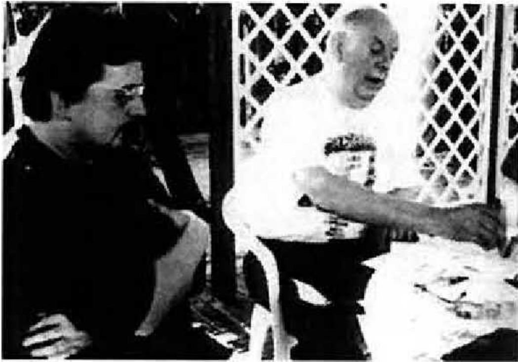
En répétition avec Dario Fo