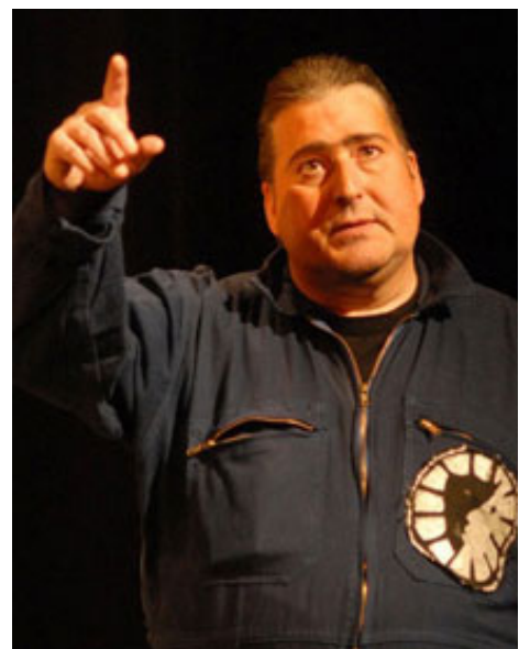
MB dans Comédie Sans Titre

Depuis son arrivé en France il mène beaucoup des actions culturelles, notamment des ateliers avec des jeunes; par exemple, à la fin de la saison 2007-2008 il crée une nouvelle pièce de Kay Adshhead, l'auteur de La Femme Fantôme , pièce spécialement écrite pour les jeunes adolescents, avec les lycéens de Saint-Denis.